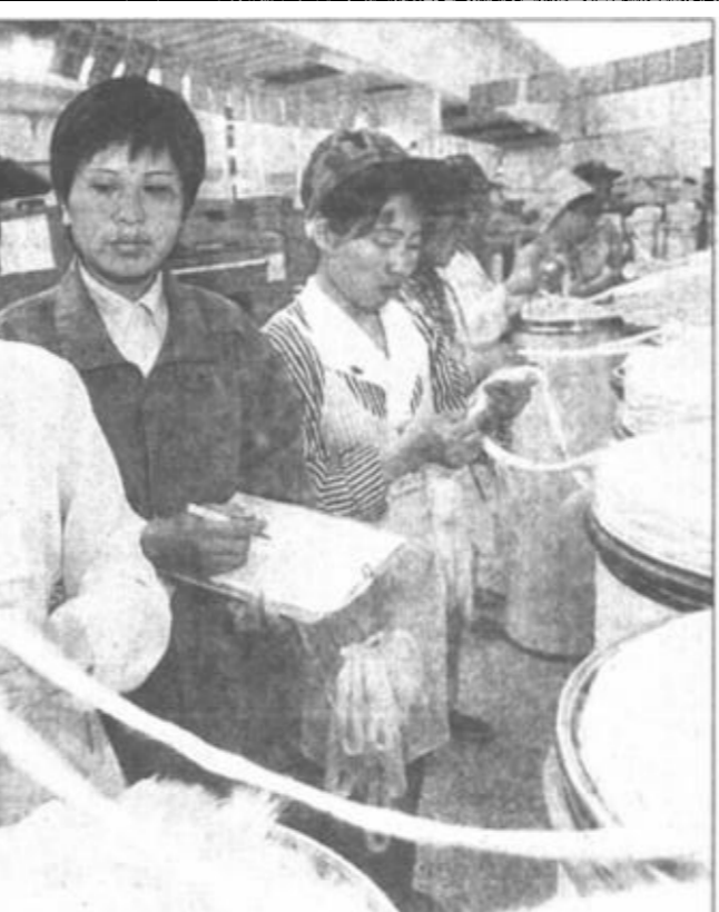
市天信纺织有限公司不断增强名牌意识，积极开展无索赔、无退货、无质量事故反馈的“争三无”创名牌活动。图为“五一”劳动节到来之际，明珠分厂举行技术练兵活动，欢度节日。

石口镇开展“教育两整顿”清理活动 近日，广饶县石口镇党委、政府集中开展“机关干部、农村党员、农村群众”活动，注重解决群众关心的热点、难点问题，强化农村思想政治教育工作，取得明显成效。